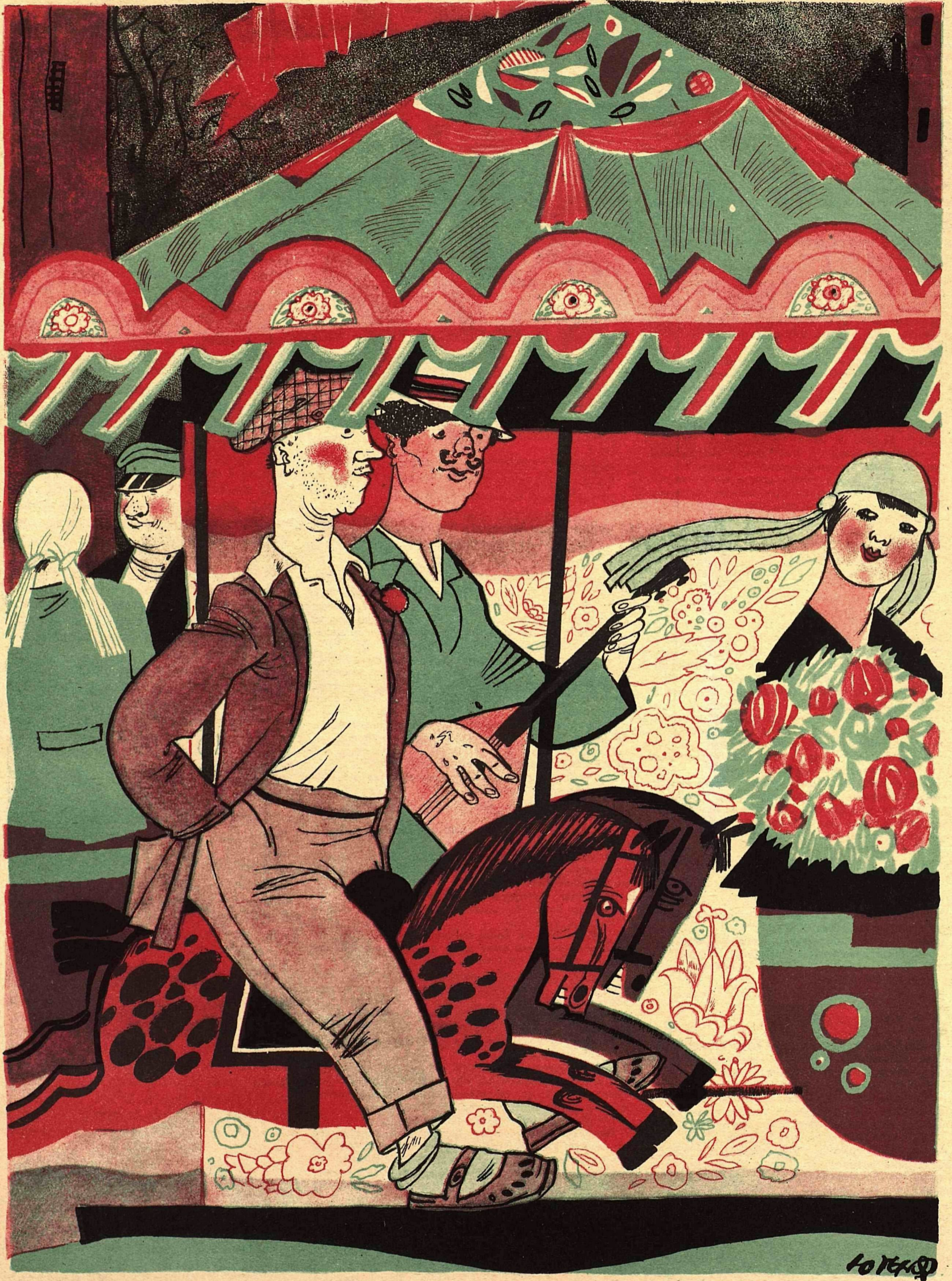
Рис. Ю. Ганфа

— А у меня голова не кружится! — На то ты и предзавкома! Вертишься целыми днями вокруг директора, ну и привык!