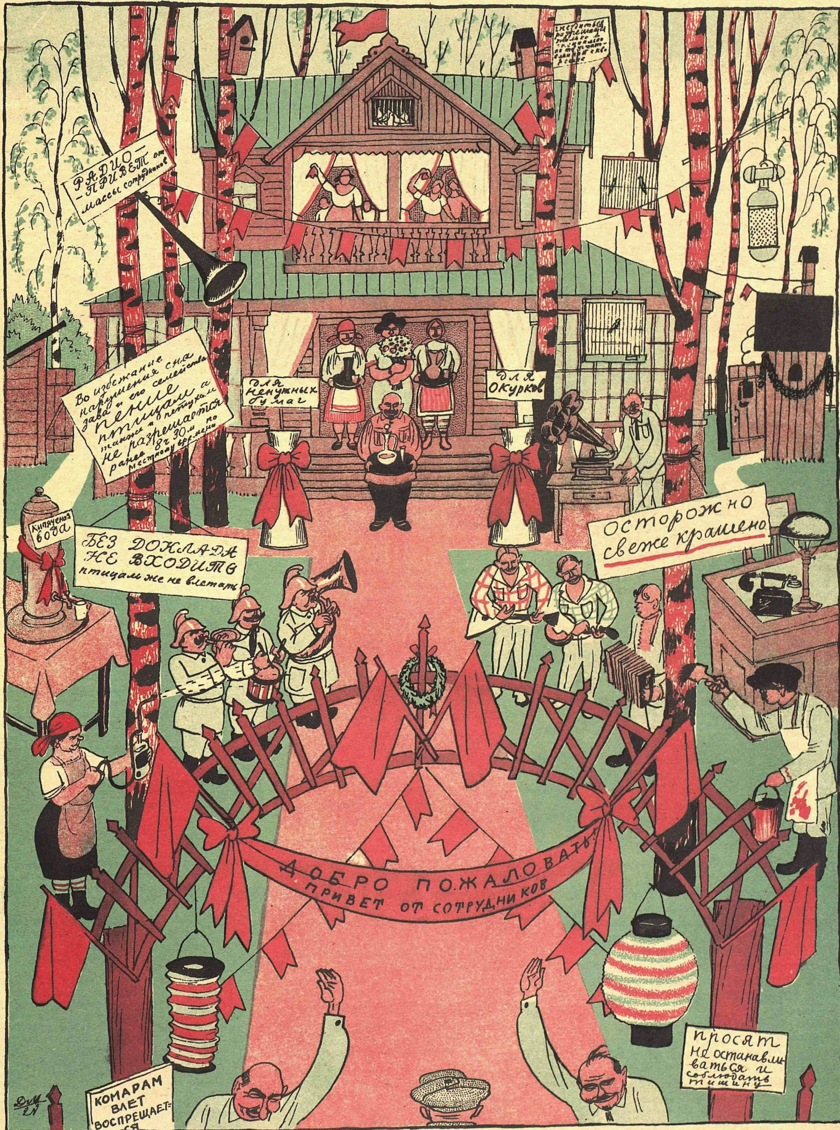
— Добро пожаловать! Лоно готово — с!