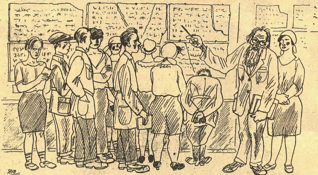
Рис Д. Мельникова

— Руководитель все говорит: „Это относится к каменному веку, это к бронзовому“, а теперь-то какой же? — Надо полагать—бумажный!