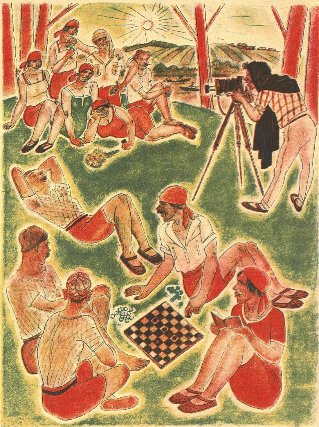
Рис. Д. М.