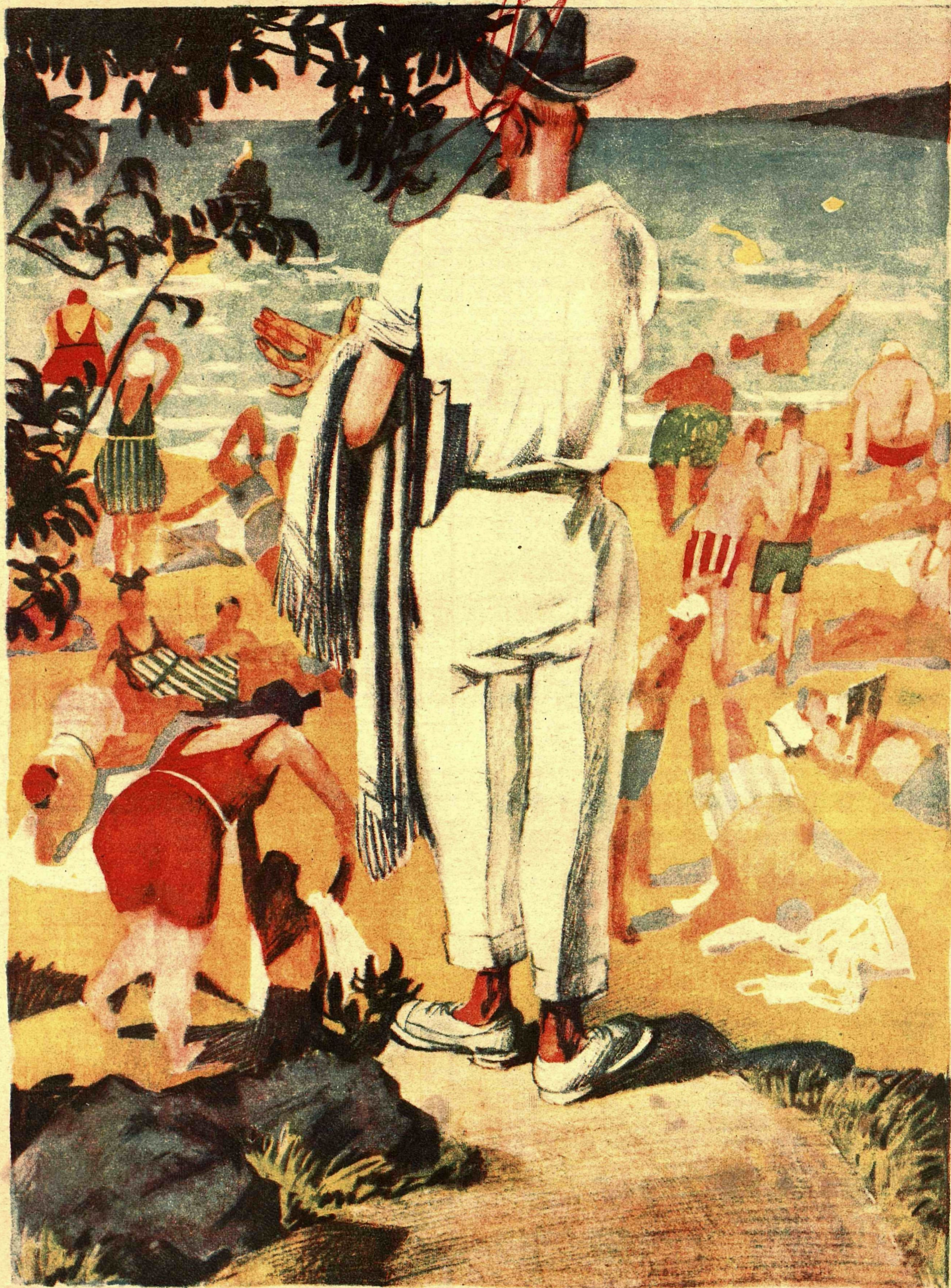
Рис. М. Черемных

— Ну, хорошо! Тут для мужчин, там для женщин, а где же для партийных?