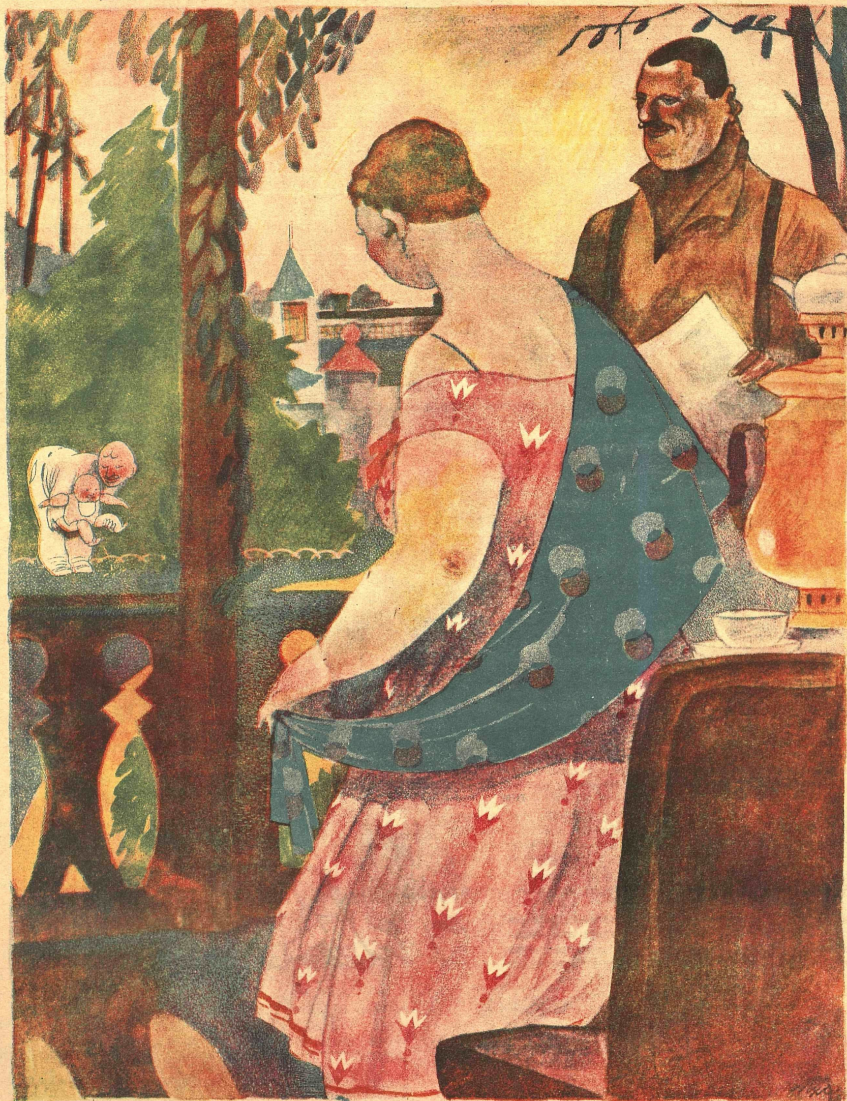
Рис. Ю. Ганфа

— Смотри, как Иван Семенович хорошо обращается с нашим Петенькой! — А за что же я его личным секретарем назначил!